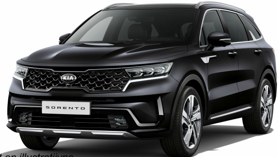
Pilt on illustratiivne