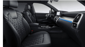
Nappa nahast istmekatted / must