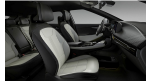
Valge vegan nahast istmekatted, musta seemisnahast äärtega