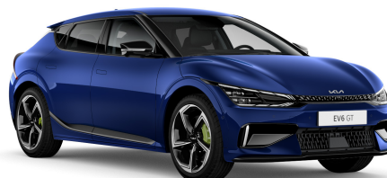
Pilt on illustratiivne