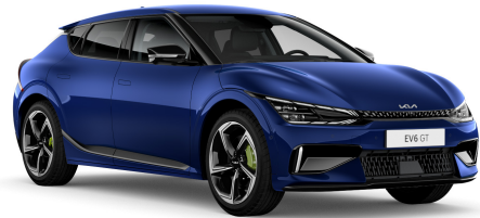
Pilt on illustratiivne