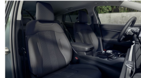
Tekstiilist istmekatted, must, EX