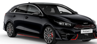
Pilt on illustratiivne