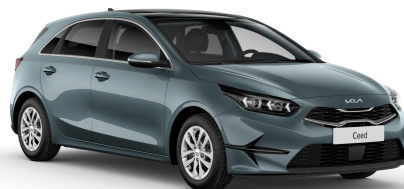
Pilt on illustratiivne