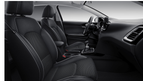
Tekstiilist kunstnahaga kombineeritud mustad istmekatted