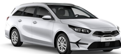
Pilt on illustratiivne