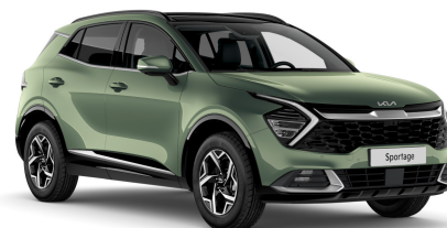
Pilt on illustratiivne