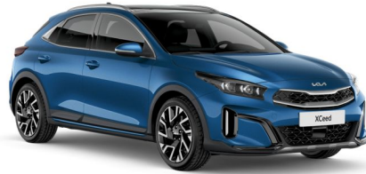
Pilt on illustratiivne