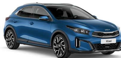
Pilt on illustratiivne