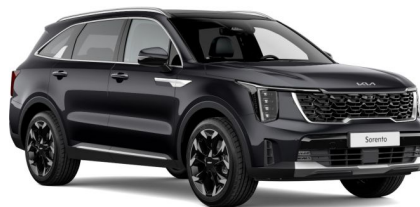
Pilt on illustratiivne