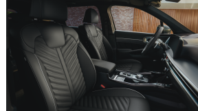
Nappa nahast istmekatted / must