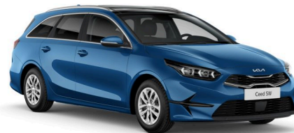
Pilt on illustratiivne