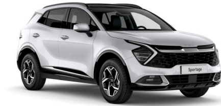
Pilt on illustratiivne