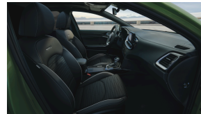
Tekstiilist kunstnahaga kombineeritud istmekatted GT-Line