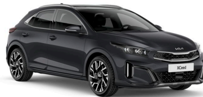
Pilt on illustratiivne