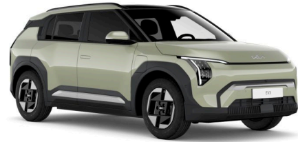
Pilt on illustratiivne