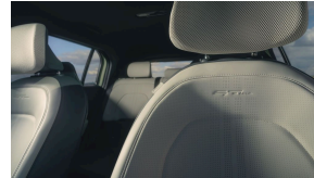
Kunstnahast istmekatted GT-Line