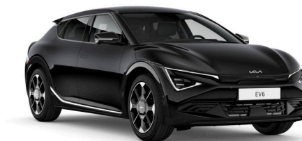
Pilt on illustratiivne