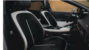
Black suede leather interior with white vegan leather bolster