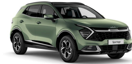
Pilt on illustratiivne